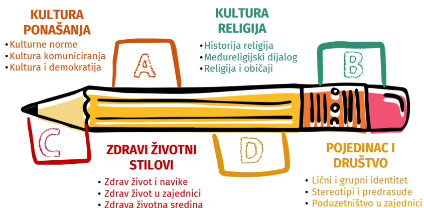
Oblasna struktura predmetnog kurikuluma Kultura i zajednica