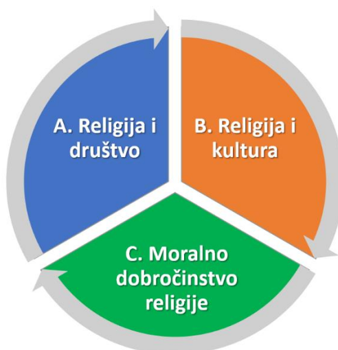
Oblasna struktura nastavnog predmeta Kultura religija